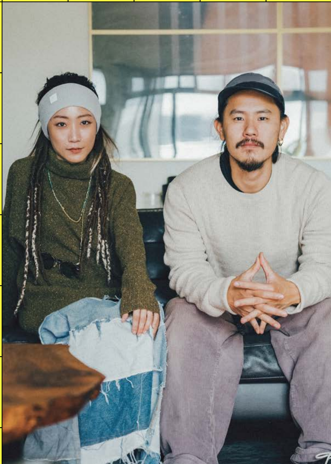
Alchemy Equipment Asynja 美麗諾羊毛混防棉針織衫 $5,480 / Sunday Afternoons 抗UV透氣棒球帽 Crushin' It Cap $980 Alchemy Equipment 粗針織高領造型修身羊毛衣 $6,980 / BUFF Crossknit 多功能針織頭帶 $980