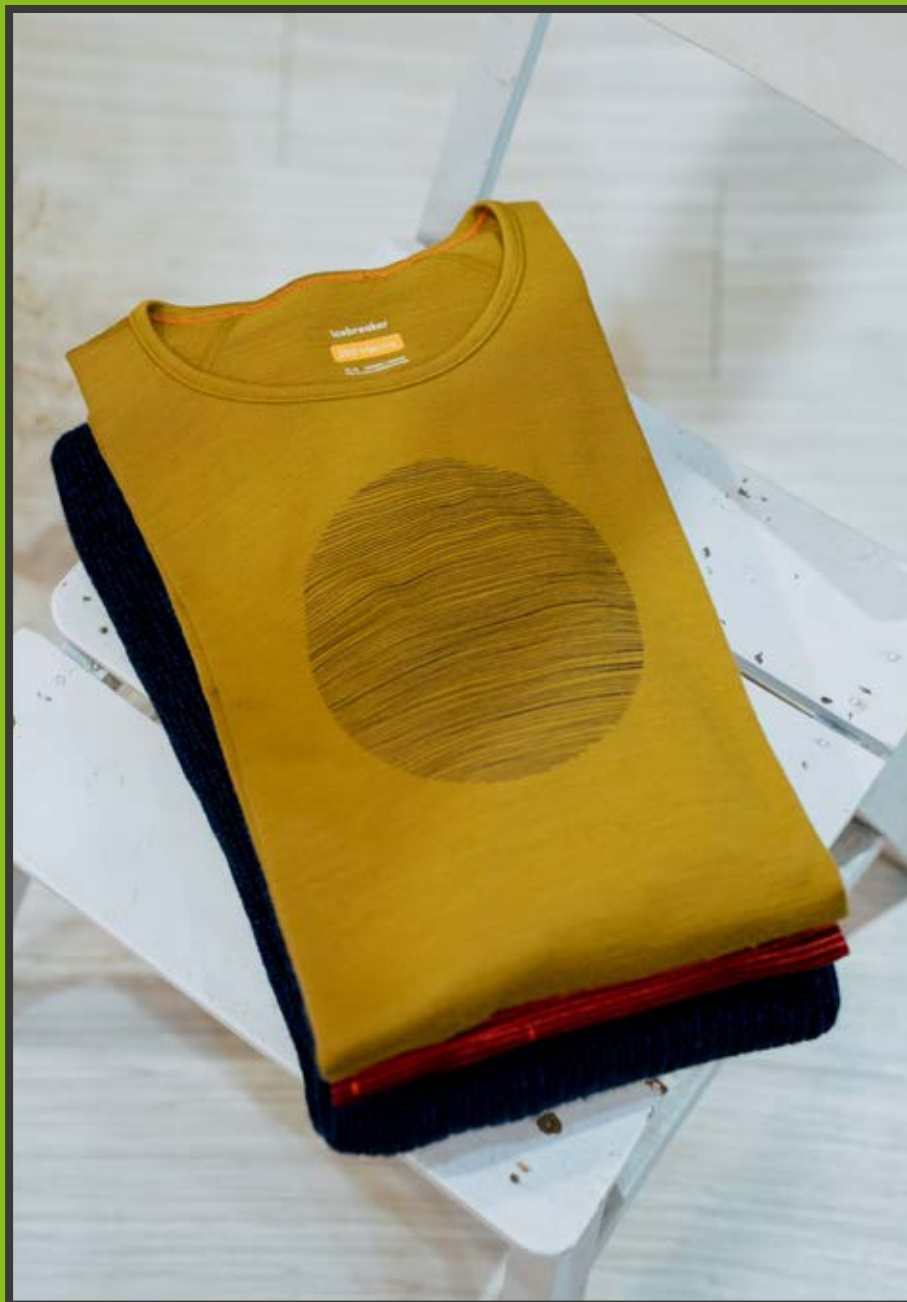
icebreaker Oasis 圓領長袖上衣 $3,480