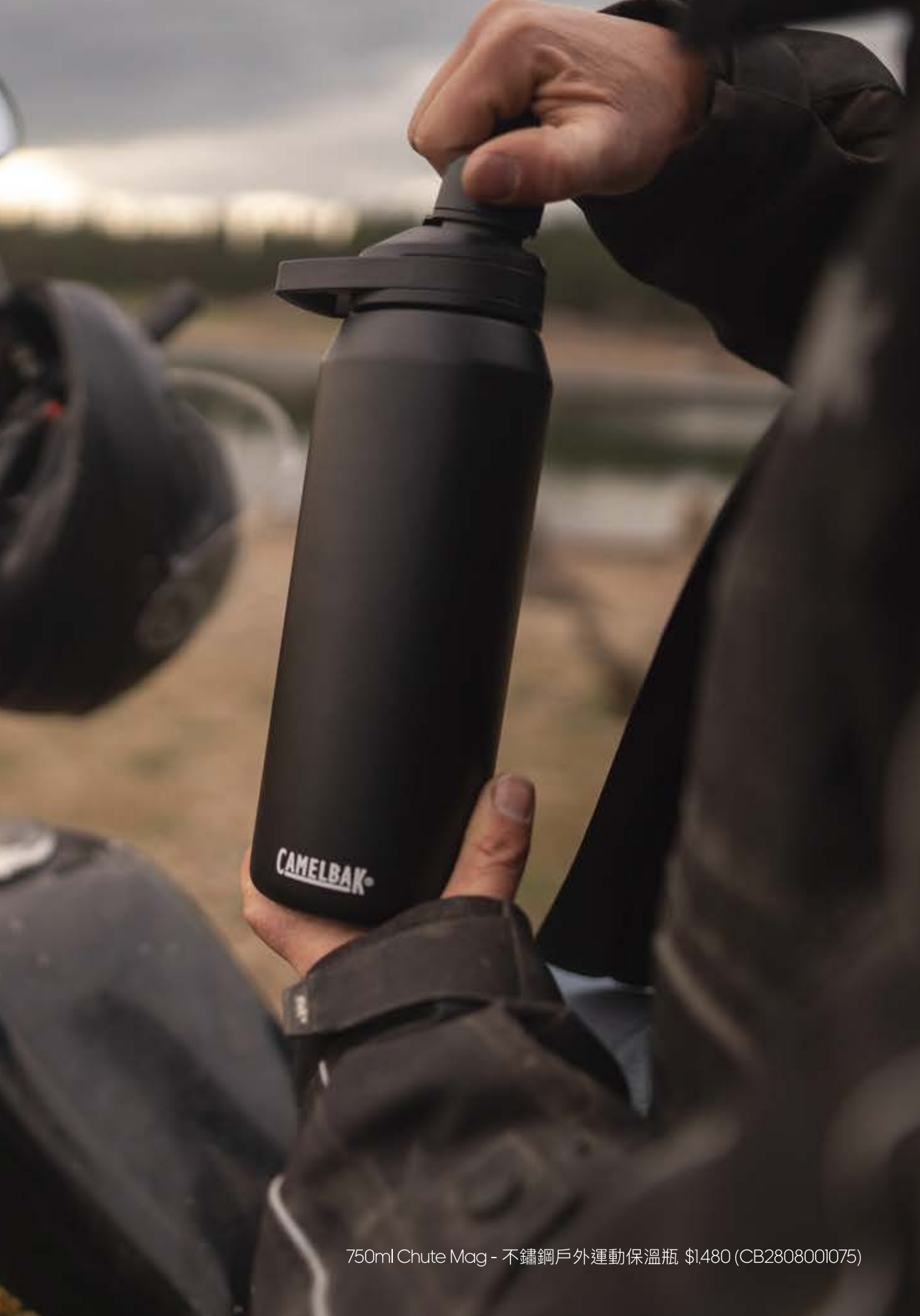
750ml Chute Mag - 不鏽鋼戶外運動保溫瓶 $1,480 (CB2808001075)