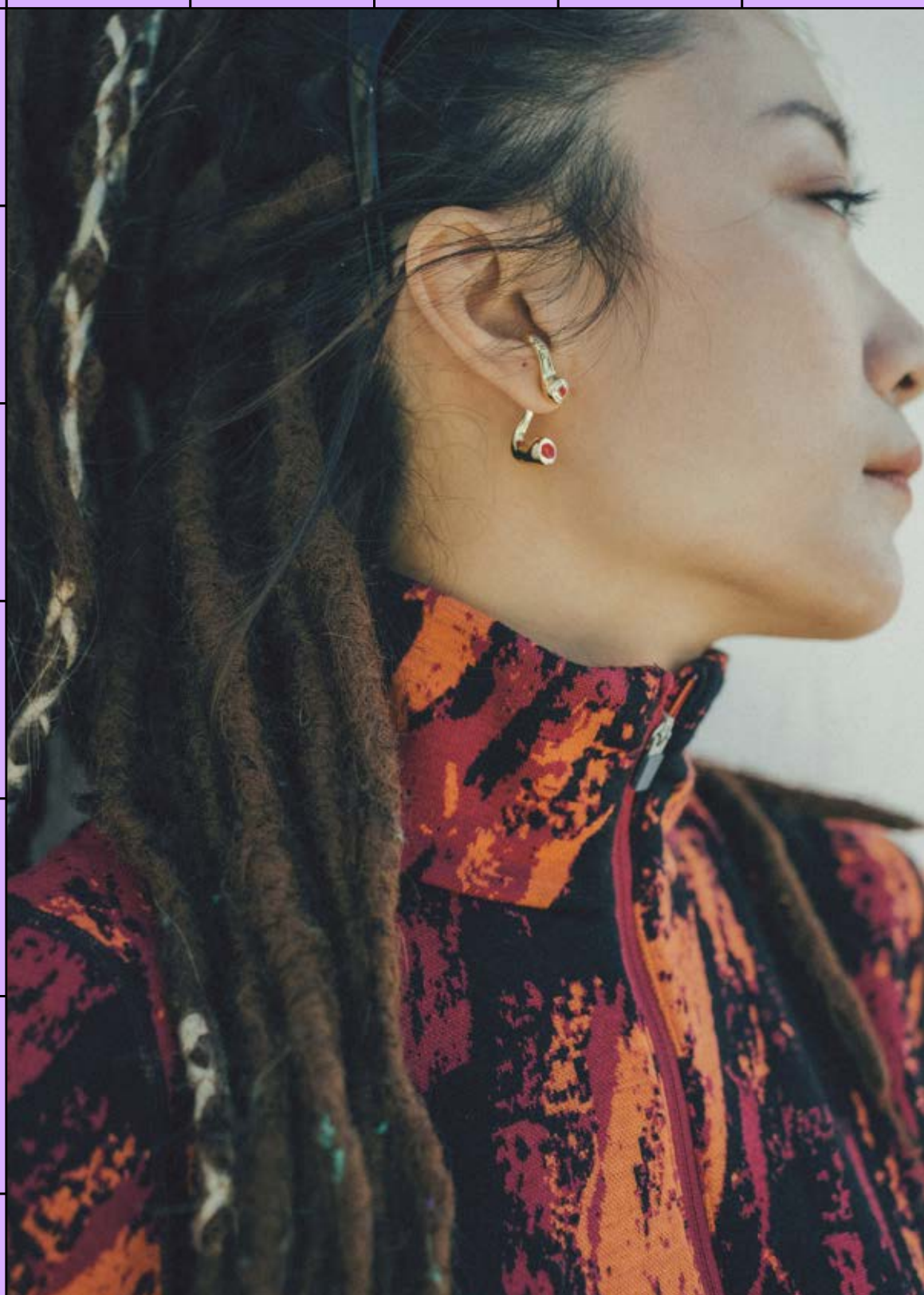
icebreaker Vertex 半開襟長袖上衣 $6,580