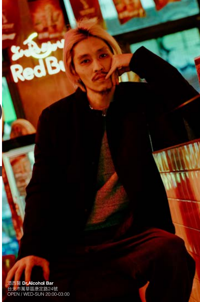
酒西醫 Dr.Alcohol Bar 台北市萬華區康定路24號 OPEN / WED-SUN 20:00-03:00

這個孩子王小黑有一個酒吧店長的夜間隱藏身份，聽起來酷帥高冷，酒西醫從店長小黑本人到整間店的菜單名稱，都隱藏著許多幽默無厘頭的特色。環境輕鬆、風格到位加上音樂以及口味優良的各種調酒，成為許多藝人、網紅、YouTuber以及各路藝文份子前來品味一番的新潮據點。